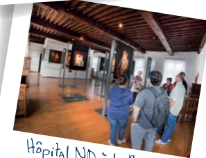
Hôpital ND à la Rose