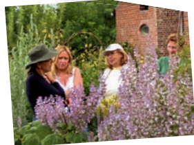
Jardins de la Grange