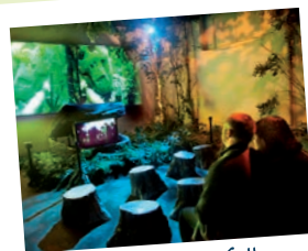
Maison du Pays des Collines