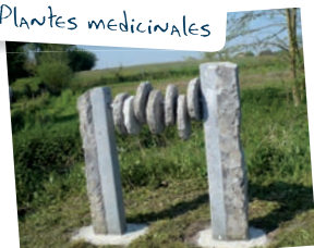
Sculpture de J-F MASSART